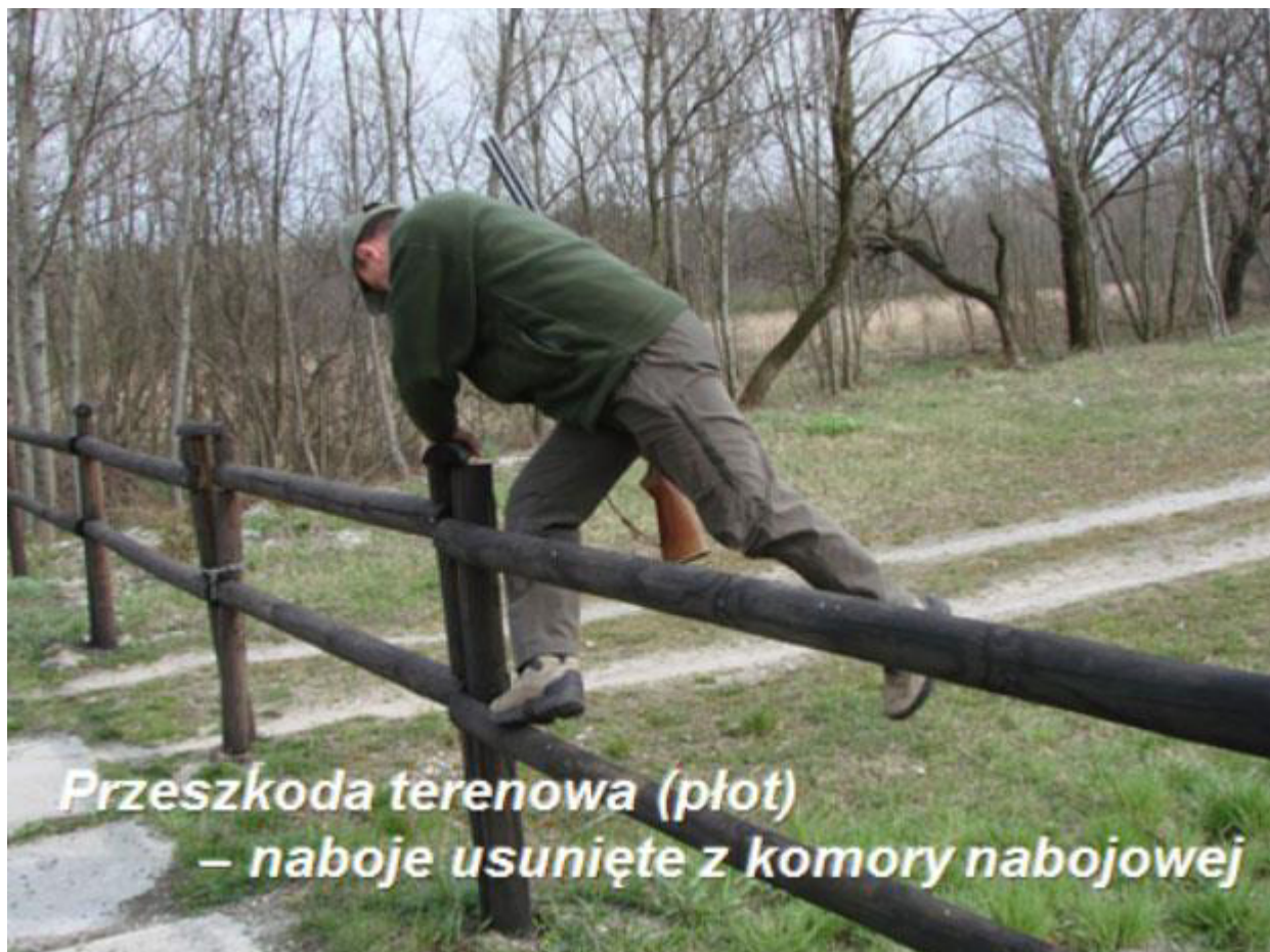
Przeszkoda terenowa (plot) – naboje usunięte z komory nabojowej